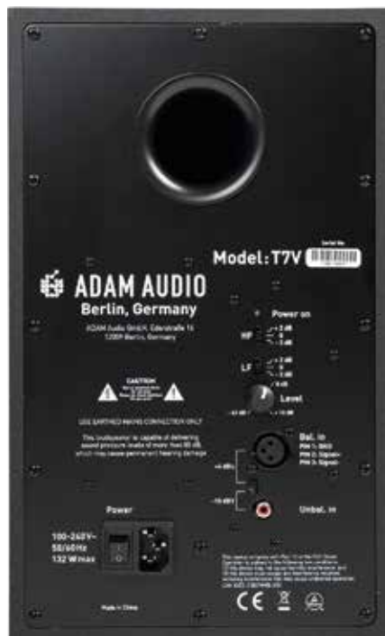
DSP-gesteuerte Zweiband-EQs sind bei Aktiv-Monitoren dieser Preisklasse selten

Der T7V schafft es tatsächlich dem ADAM-Sound treu zu bleiben. Warm und trotzdem natürlich. Weich und exakt zugleich. Der U-ART-Hochtöner leistet dabei ganze Arbeit und macht ermüdungsfreies Hören auch bei ausgedehnten Hörsessions möglich. Am Beispiel von Woodkids Titel „Stabat Mater“, welcher dem Lautsprecher eine große Balance zwischen brachialer Kick-Bassdrum, breit gestaffelten Chören und sibilanter Stimme abverlangt, wird deutlich, wo die Stärken des Lautsprechers liegen: In der Abstimmung. Die ist tatsächlich sehr überzeugend. Sowohl die Höhen bis 25 Kilohertz, als auch der Bass bis immerhin 39 Hertz wirken solide geformt und stimmig. Die Übergangsfrequenz von 2,6 Kilohertz ist kaum ver-