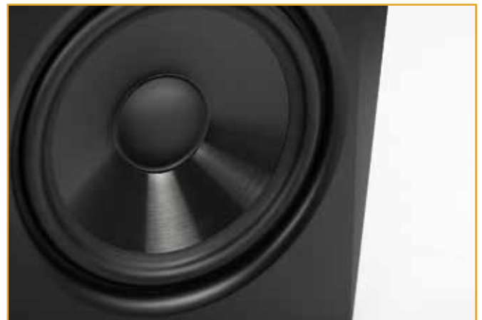
Der 7 Zoll große Tief-Mitteltöner spielt dank Bassreflex-Konstruktion bis 39 Hertz. Und das verhältnismäßig kompressionsarm